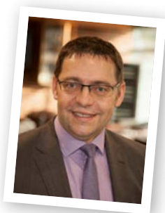
Klaus Muttach Oberbürgermeister